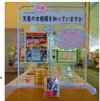
2月のひとつぼ展示の様子