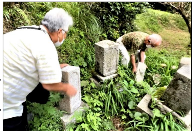
喜平治が住んだ猪ノ熊村の庵内墓地