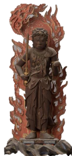
木造不動明王立像 大日如来が化身したものとされる。

主な参考文献・資料：野口一雄 著 「天童再発見 人びとのくらし第2集 ふるさと探訪」令和3年5月31日発行 「郷土てんどう第50号」天童愛宕神社の再建 令和4年3月31日 発行