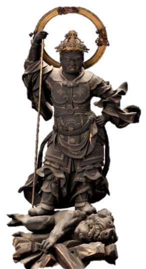
木造毘沙門天立像 北方守護の仏として、特に密教系寺院で広く信仰された。