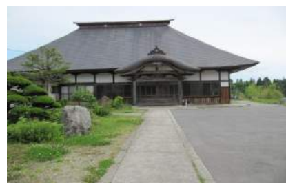
大江町荻野長泉寺