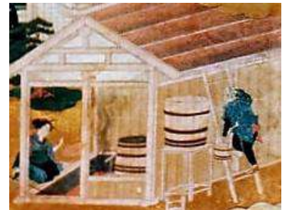
絵馬「薄荷栽培製法之図」(部分)

明治 23 年(1890)、山形市錦町神明神社に絵馬「薄荷栽培製法之図」(以下、絵馬)が奉納された。(現、山形市郷土資料収蔵所蔵)絵馬には、薄荷の蒸留に使用する大桶や作業する人物が描かれ、上部には「解説書」がしたためられている。それには、「薄荷 内国紫薄荷正油」、「産地 羽前国北村山郡山口村字大槻 原ノ前」、「平地 壠土(黒土)」、「現今反別及ヒ年度(以下略)」、「薄荷畑仕立方法(以下略)」、「施肥料(以下略)」、「製造法 竈上ニ大桶ヲ載セ乾燥シタル薄荷ヲ其桶中ニ入レ 而シテ外該上ニ鍋ヲ据エ水ヲ入レ其水ノ暖カナルニ從ヒ薄荷油水ヲ得 而シテ之ヲ分析シ真ノ薄荷油ヲ得 所謂焼酎ヲ製スルニ髣髴タリ」、「地位及地価(以下略)」、「收穫ノ高(以下略)」、「耕作反別損益(中略)差引純益惣合計金六百三拾四円五拾銭ヲ得ル」と記されている。